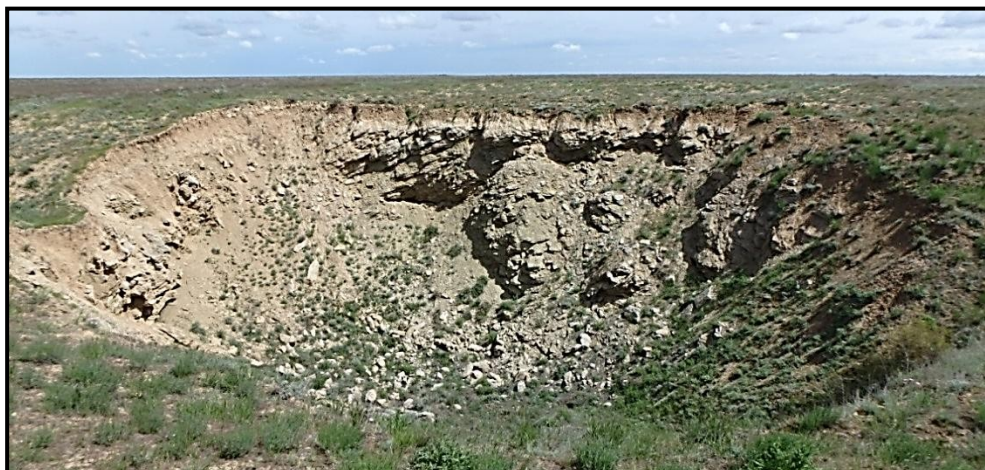
Рис. 5. Старый выположенный карстовый провал

Выводы. По результатам проведённого исследования можно сделать ряд выводов. Провалы являются не самой характерной формой поверхностного карстового рельефа и встречаются довольно редко на территории окрестностей оз. Индер. В Индерском карстовом районе провалы встречаются двух основных типов: суффозионно-провальные (или суффозионно-карстовые) и коррозионно-провальные (или коррозионно-гравитационные). В первом случае образование воронки происходит за счёт обрушения свода полости, образовавшейся в рыхлых отложениях, вследствие вымывания покровных отложений в нижележащие полости (в т. ч. различные по размеру каверны, каналы, закарстованные трещины и пр.), расположенные на поверхности карстующихся пород, либо за счёт освобождения от рыхлого заполнителя погребённых карстовых форм. Во втором случае провал образуется за счёт обрушения свода карстовой полости в коренной породе, сформировавшейся, как правило, в результате гипогенного карста. Аналогичные провалы характерны для карста возвышенности Биш-чохо (Бесшоқы) в Курмангазинском районе Атырауской области Республики Казахстан. Провалы первого типа, т.е. суффозионные провалы с карстовой провокацией довольно редко встречаются в окрестностях озёра Индер, по сравнению с Прибаскунчакским карстовым районом, расположенным в Астраханской области.