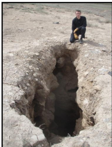
Рис. 1. Карстовый провал