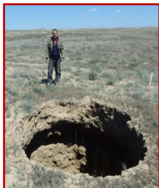
Рис. 3. Свежий провал