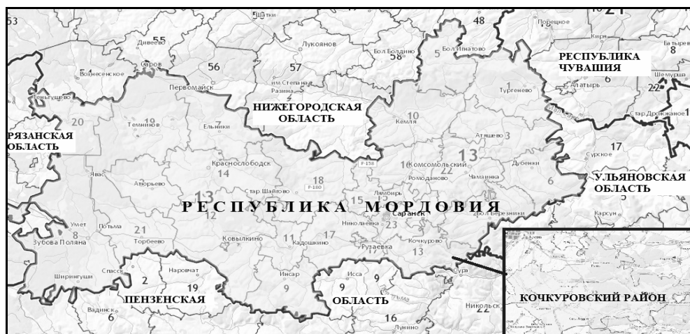
Рис. 1. Кочкуровский район Республики Мордовия

В настоящее время 1,8 тыс. га (7 %) агроландшафтов района не используются в сельскохозяйственном производстве, из которых 0,14 тыс. га (9%) подвержены процессам зарастания, а 1,43 тыс. га (91%) – водной и ветровой эрозии. Данные негативные процессы ограничивают рост урожайности сельскохозяйственных культур в районе (табл. 1).