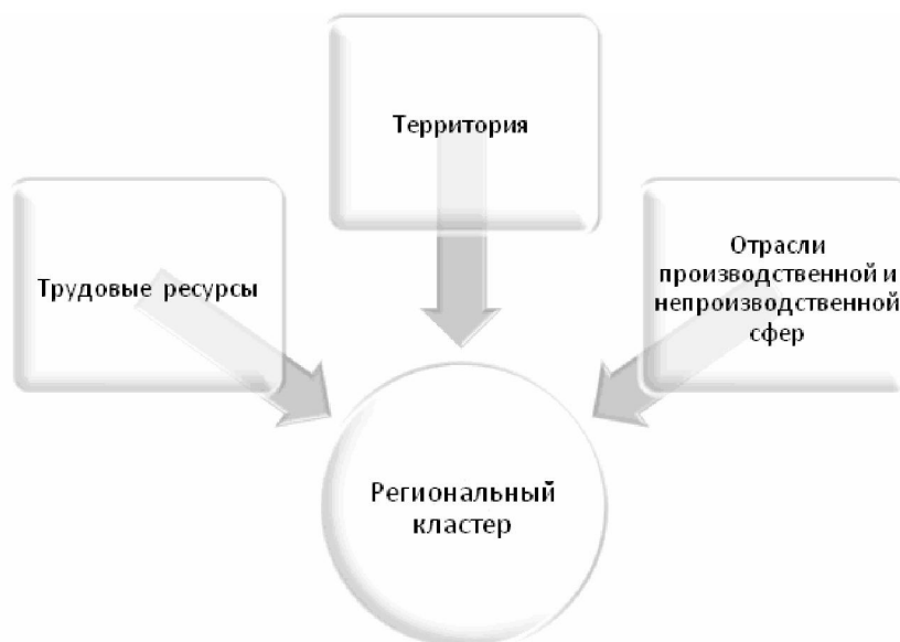
Рис. 1. Структура регионального кластера

3) трудовые ресурсы. Важным звеном любого регионального кластера являются высококвалифицированные специалисты. При этом кадры не должны «стареть», а должен обеспечиваться постоянный круговорот кадров.