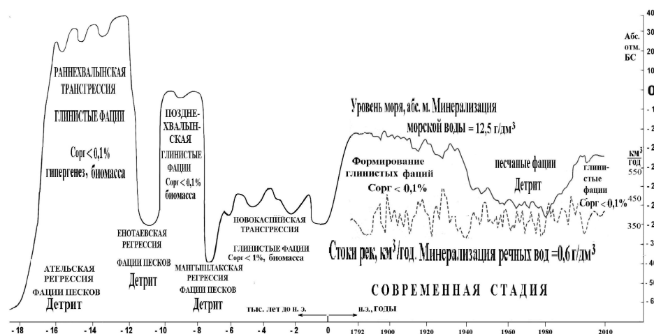
Рис. 1. Цикличность формирования органического вещества и накопления осадочных фаций Каспийского моря

В четвертичное время Каспийское море трансгрессировало в бакинское, нижнехазарское, верхнехазарское, нижнехвалынское, верхнехвалынское и в новокаспийское время. Наиболее значительной была раннехвалынская трансгрессия, в результате которой уровень моря достигал отметок 47–50 м абс. выс., т.е. был на 75–78 м выше современного. Вследствие этого отложения, береговые линии более ранних и более низких бакинской и хазарских трансгрессий были затоплены и перекрыты морскими отложениями. Поэтому большая часть Прикаспийской низменности представляет собой нижнехвалынскую морскую равнину (рис. 1).