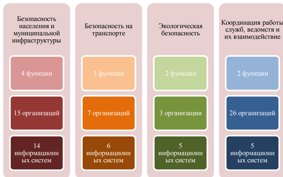
Рис. 2 Структура АПК «Безопасный город» на территории Астраханской области

Построение базовых блоков осуществляется как путём внедрения новых технических решений, так и организацией совместного согласованного использования ранее достигнутых результатов по созданию мониторинговых и управляющих систем, совершенствованием механизмов взаимодействия органов управления единой государственной системы предупреждения и ликвидации чрезвычайных ситуаций (далее – РСЧС) на всех уровнях с использованием возможностей информационно-телекоммуникационных технологий.