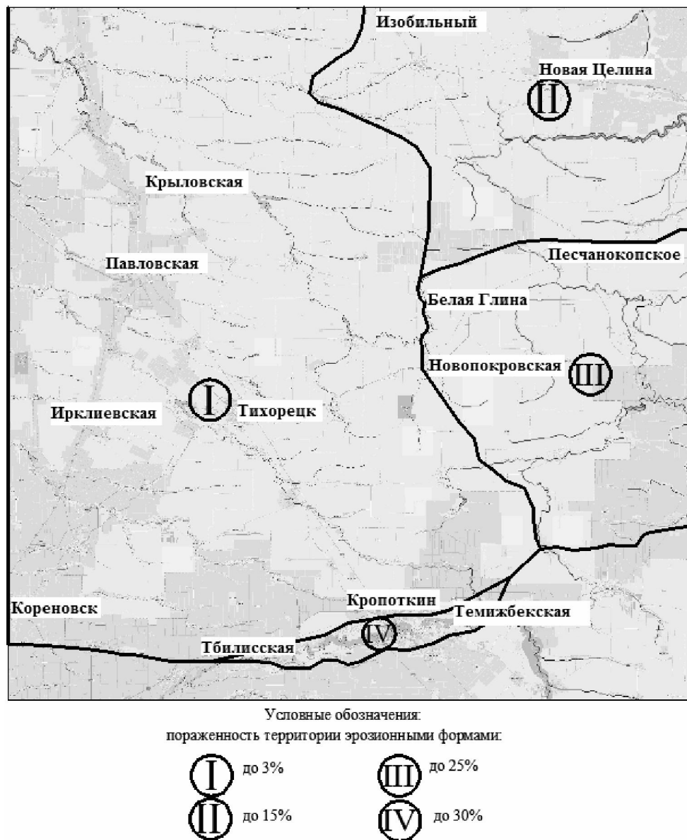
Рис. 1. Схематическая карта пораженности эрозионными процессами северо-восточной части Азово-Кубанской равнины

В настоящее время комплексных исследований эрозионных процессов в пределах Азово-Кубанской равнины не ведется. По данным дешифрирования космических фотоснимков и анализу картографического материала, автором составлена схематическая карта пораженности эрозионными процессами северо-восточной части Азово-Кубанской равнины (рис. 1).