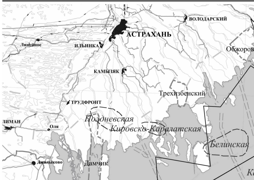
Рис. 1. Обзорная схема района исследований

В 1960–1963 гг. на Подневском и Ново-Георгиевском поднятиях трестом Калмнефтегазразведка было пробурено несколько разведочных скважин глубиной от 1700 до 2120 м, вскрывших отложения доюрского возраста. Это – скважины Подневские 1, 2, 3, 4 и Ново-Георгиевские 5, 6. К северо-западу от площади работ пробурены скважины Марсыньские 1 и 2. Во всех скважинах проведен стандартный комплекс исследований (ГК, БК, ПС, НГК, ГЗ), и произведен отбор кернa. В результате испытаний скважин выявлены пласты с хорошими коллекторскими свойствами, в некоторых скважинах наблюдались газопоказания по газовому каротажу, однако залежей углеводородов обнаружено не было.